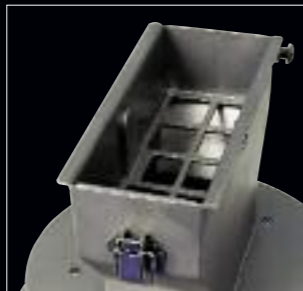
Gehäuse mit Nusseinwurf Boîtier avec réceptacle de noix Grattugia con inserto per noci Housing with nut chute