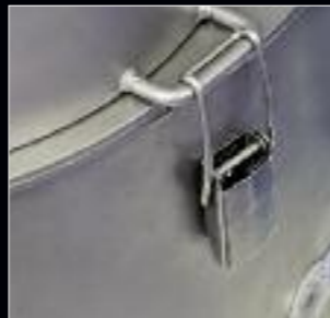
Gehäuse-Schnellverschluss Fermeture rapide du boîtier Chiusura rapida del corpo principale Rapid-lock housing