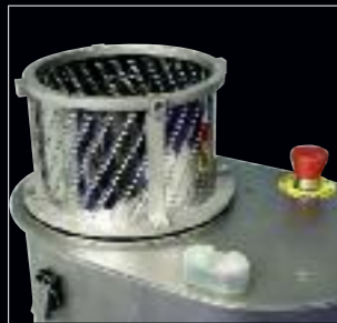
Gerät mit aufgesetzter Trommel Appareil avec son tambour supérieur Apparecchio con tamburo montato Machine with inserted drum