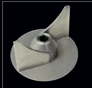
Reibflügel Standard Aile de râpage standard Alette per grattugiare standard Grater wings, standard