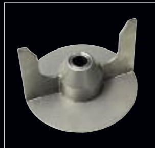
Reibflügel neutral Aile de râpage neutre Alette per grattugiare neutre Grater wings, neutral

The PKR is optionally available with a stainless steel machine table, as a mobile floor-mounted appliance.