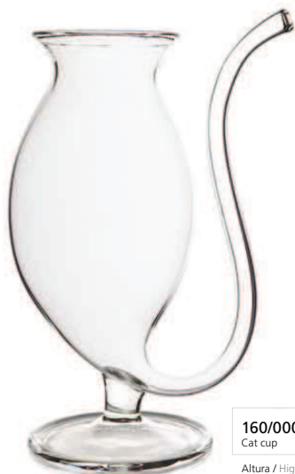
160/0008 Cat cup Altura / High: 170 mm