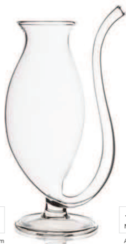
160/0013 Mini Cat cup Altura / High: 150 mm

Copa ideal para beber y sorber bebidas con hielo seco, servir sopas con diferentes temperaturas o texturas, diseño apto para utilizar Cocktail Master o cualquier herramienta parecida.