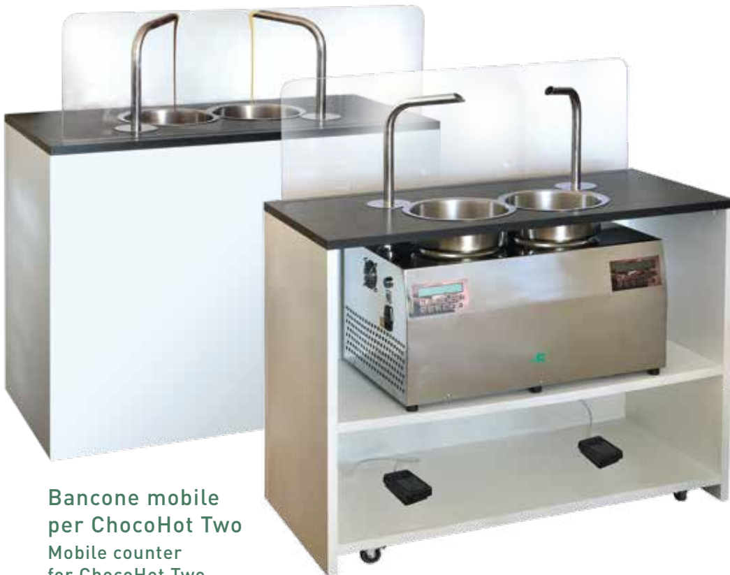
Bancone mobile per ChocoHot Two Mobile counter for ChocoHot Two 14.1.MC2