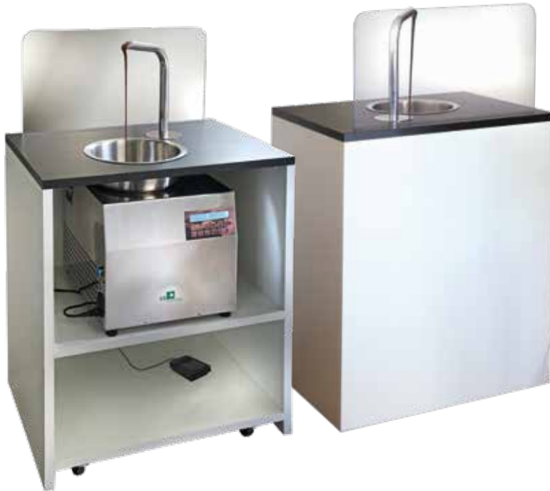
Bancone mobile per ChocoHot One Mobile counter for ChocoHot One 14.1.MC